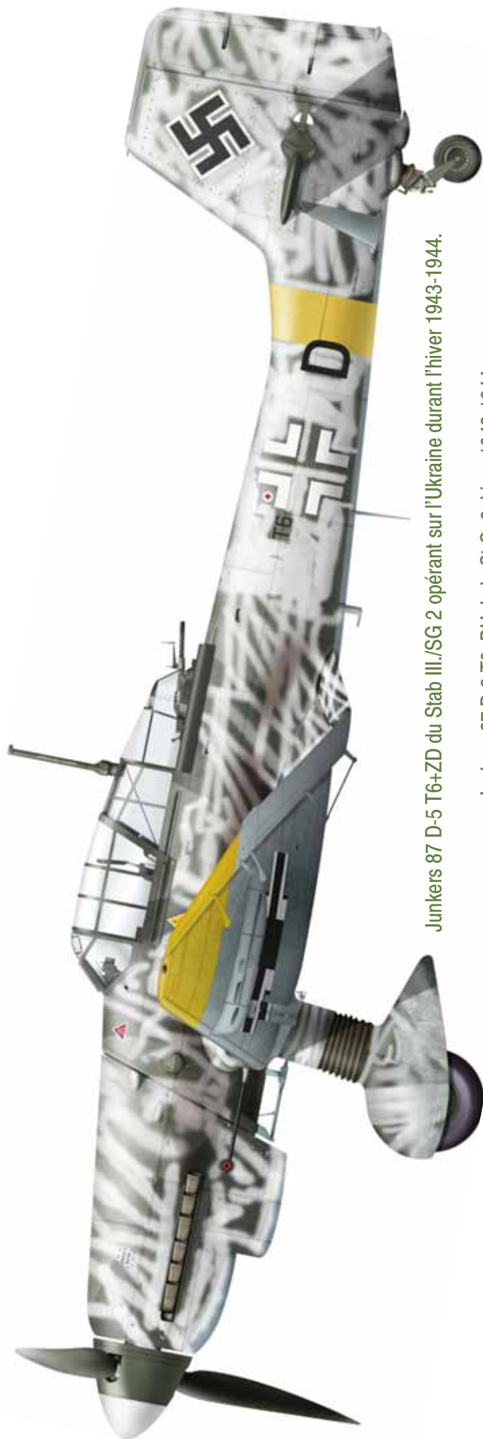
Junkers 87 D-5 T6+ZD du Stab III./SG 2 opérant sur l'Ukraine durant l'hiver 1943-1944.