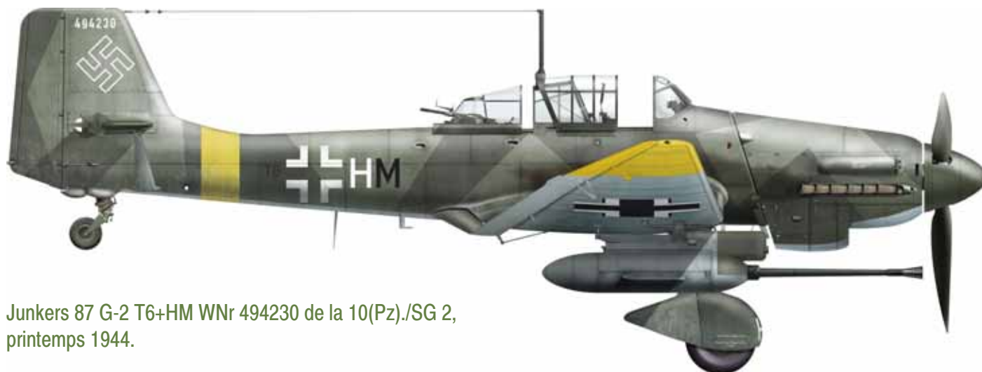
Junkers 87 G-2 T6+HM WNr 494230 de la 10(Pz)/SG 2, printemps 1944.