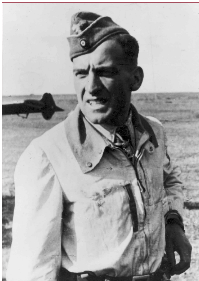
Rudel après un vol en octobre 1943.