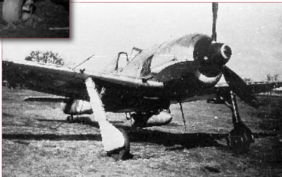
Les FW 190 du II./SG 2 vont évacuer la Crimée pour se rassembler en Roumanie.