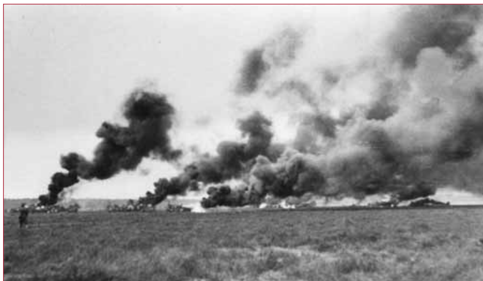
Un terrain de la JG 54 après un bombardement soviétique.

Un autre pilote du I. Gruppe est à la fête : l' Oberfeldwebel Otto Kittel, qui a abattu son 100 e avion ennemi (un La-5), bientôt suivi