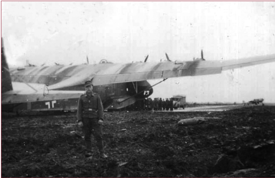
Un Me 323 du I./TG 1 chargé du ravitaillement de la région de la Baltique. À l'arrière-plan, un FW 190 de la JG 54