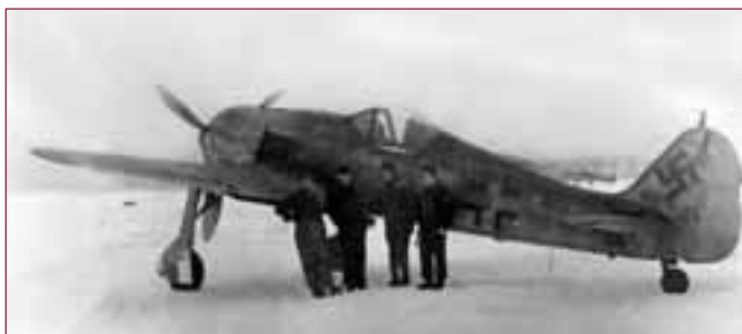
Un pilote du II./JG 54 et trois membres du personnel de piste devant le FW 190 A-8 "7 bleu" (WNR 738294) à Libau-Nord au cours de l'hiver 1944-1945.