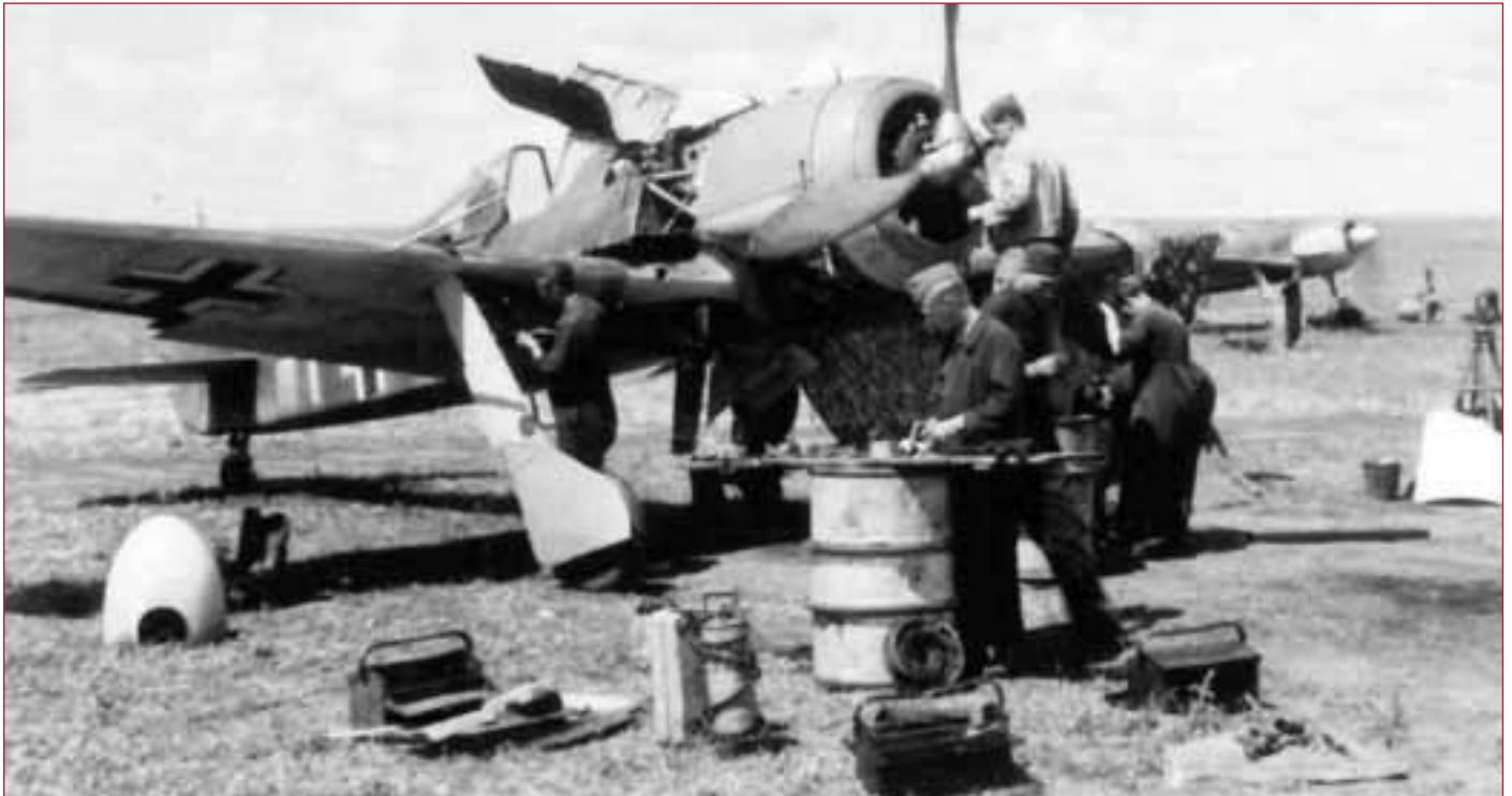
Entretien de deux FW 190 à l'été 1943. (Dreyling)

L'Uffz Anton Held dans l'habitacle de son FW 190 A-4 "7 blanc". Ce pilote est crédité d'un Yak-7 dans la matinée du 7 juillet 1943 près de Ponyri. La septième de ses quatorze revendications.