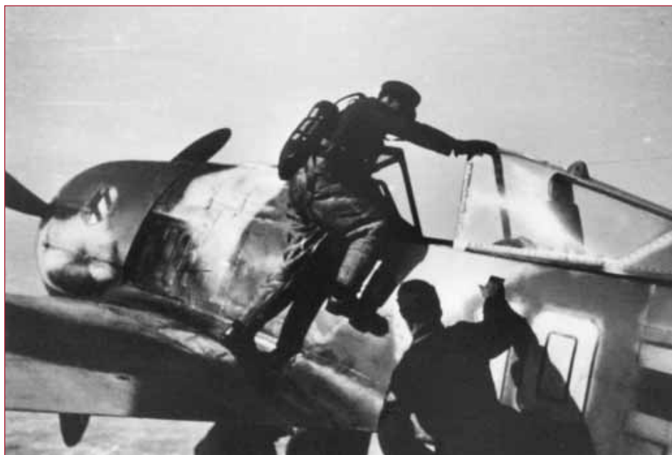
L'Oblt Walter Nowotny, le commandant de la 1. Staffel , grimpe dans son FW 190 A "10 blanc".

Le 14 mars à 13h28 au nord-est de Korowitschno, Hans Philipp et son ailier, l'Uffz Hans-Günther Reinhardt, piquent sur deux Kittyhawk appartenant à l'une des escadrilles de la flotte de la Baltique. Les P-40 sont irrémédiablement surclassés. Un troisième appareil de fabrication américaine est abattu moins d'une heure plus tard par le Fw Heinrich Sterr de la 6. Staffel . (sa 27 e v.). Sept LaGG-3 et deux Pe-2 viennent compléter la liste de cette journée. Un autre pilote est à l'honneur : l' Oberfeldwebel Herbert Brönnle récompensé de la Ritterkreuz pour ses cinquante-six victoires.