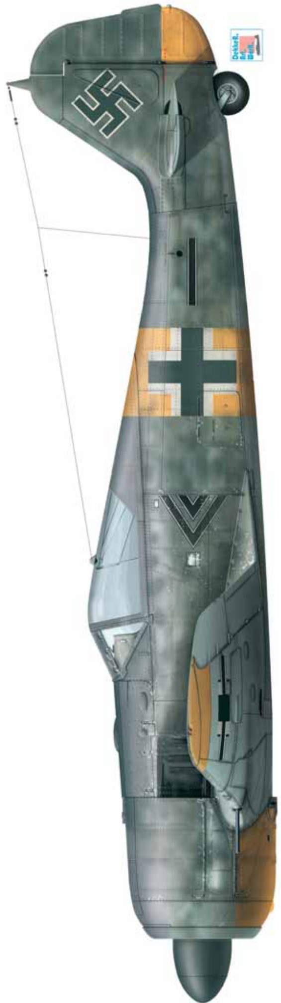
FW 190 A-6 "double chevron noir" piloté par le Hauptmann Erich Rudorffer, Gruppenkommandeur du II./JG 54, Petchory, mars 1944.