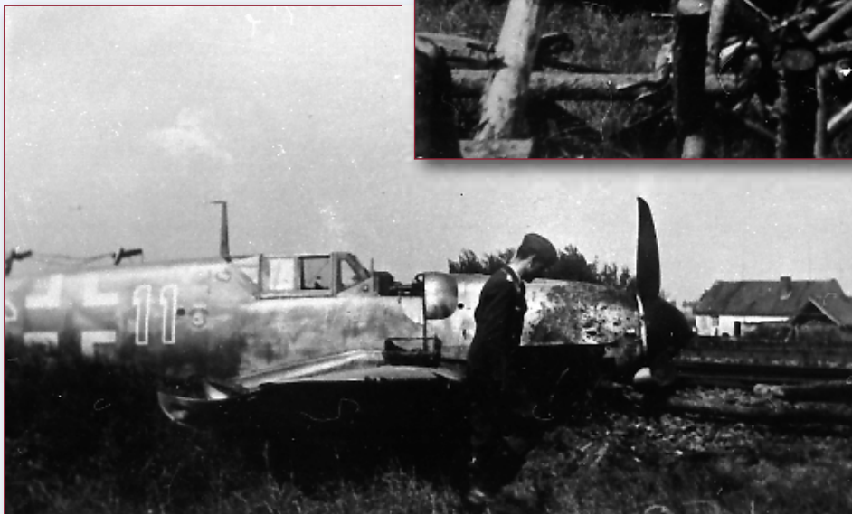
Le 14 mai 1943, l'Oblt Erwin Leykauf, le Staka de la 12./JG 54, tenta un décollage lors du raid de l'Usaaf sur la base de Wevelgem. Mais le train de son Bf 109 G-6 (WNR 19632) "11 bleu" tomba dans un cratère de bombe.