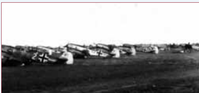
Bf 109 E de la JG 26 alignés sur la piste de Moorseele en 1940. Une partie de la 11.(Höhe)/JG 54 gagna cet aérodrome le 14 mai 1943 au départ de Merville. (E. Vanackere)