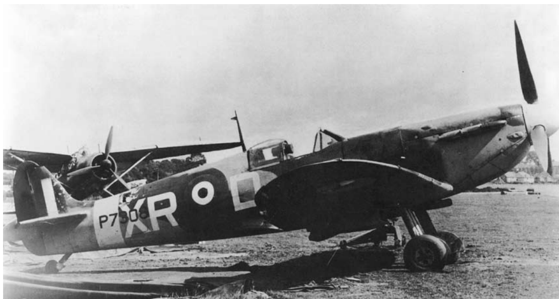
Le Spitfire Mk.IIa P7308/ XR-D piloté par le P/O Bill Dunn lors du Circus N° 86 le 27 août 1941. On distingue nettement les dommages subis sur la partie arrière de l'appareil, photographié à Hawkinge. L'appareil fut réparé puis transformé en Spitfire Mk.Va !

s'ajoutant aux onze autres Squadrons du Circus N° 85. Les chasseurs allemands vont revendiquer dix victoires : sept pour la JG 26 et trois pour la JG 2 (qui se montre bien modérée ce jour-là !).