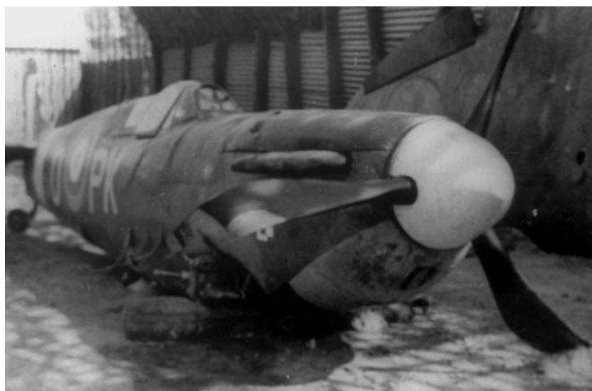
Le fuselage du PK-O en attente de transport.

Le 29 août, pas moins de quatre Spitfire du N° 19 Sq. sont victimes de Bf 110 du Häifischgruppe (II./ZG 76). Sur cette photo, un appareil de la 6./ZG 76 fait chauffer ses moteurs sur le terrain de Leeuwarden au cours de l'été 1941.