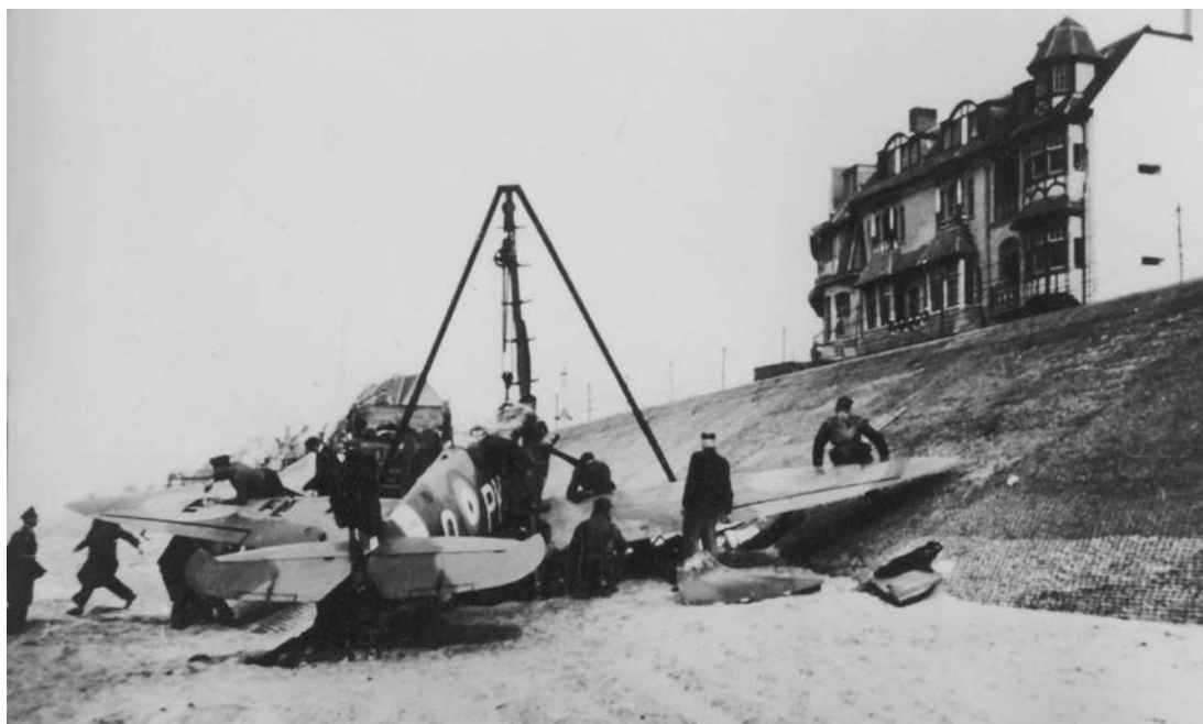
Le PK-O, peu endommagé, sera rapidement démonté.

-le N° 485 Sq. perd un Spitfire tombé en mer mais dont le pilote, le Sgt Griffiths, sera sauvé par l'ASR ; -les Squadrons polonais sont affectés par la mort en combat des Sq/Ldr Jerzy Slonski-Ostojka (N° 306 Sq.) et P/O Jerzy Bettcher (N° 308 Sq.). Le F/Lt Bronislaw Mickiewicz (N° 315 Sq.) sera par contre capturé après s'être posé sur la plage belge de Westende ; -le Sgt Phillip Grisdale du N° 72 Sq., dont l'avion fut atteint par les tirs de l'Oblt Hermann Segatz de la 4./JG 26, signalera par radio tenter de se poser mais périt près de Zandvoorde.