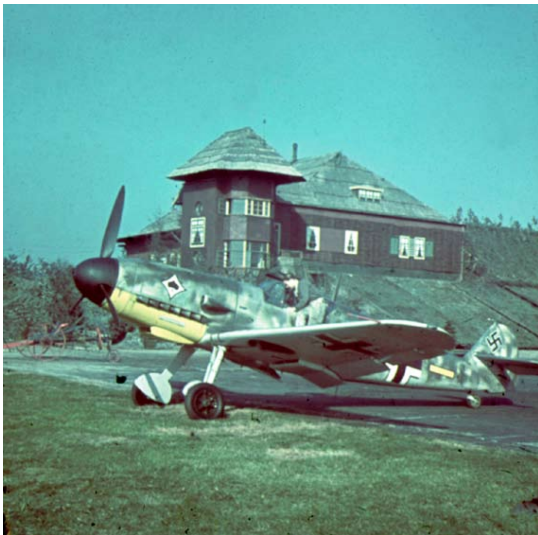
Un Bf 109 de la JG 53 affecté temporairement à la défense de l'espace aérien néerlandais.

une patrouille anti sous-marine s'écrase en France. Deux aviateurs sont capturés tandis que les deux autres peuvent s'évader et revenir en Grande-Bretagne. Cette perte est de nouveau citée pour mémoire car elle ne peut être rattachée au concept de la Non Stop Offensive.