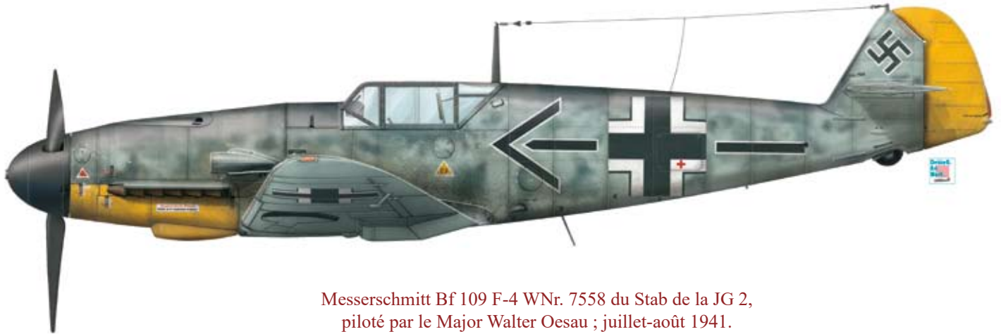
Messerschmitt Bf 109 F-4 WNr. 7558 du Stab de la JG 2, piloté par le Major Walter Oesau ; juillet-août 1941.