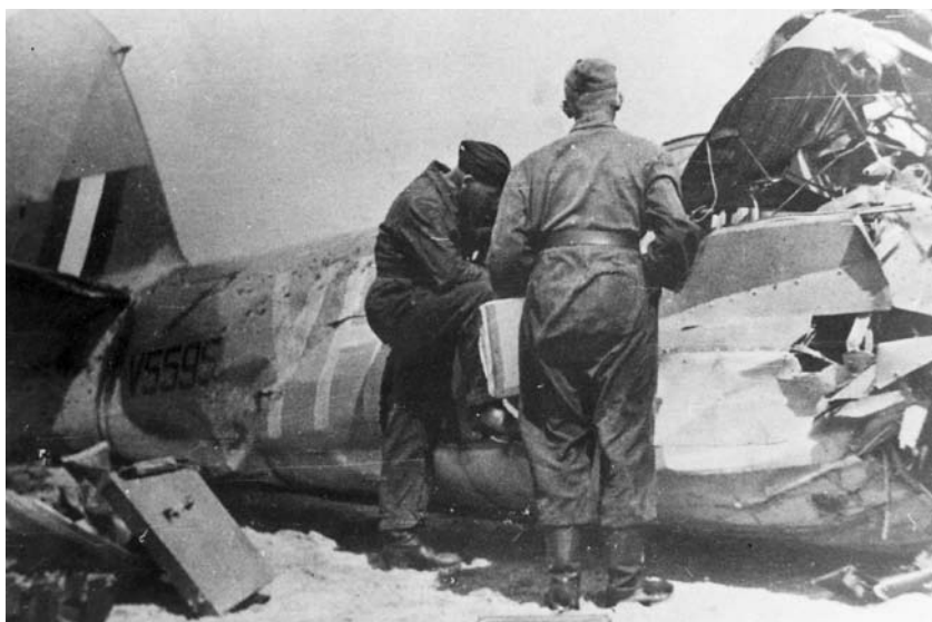
Des membres de la Luftwaffe curieux inspectent l'épave.