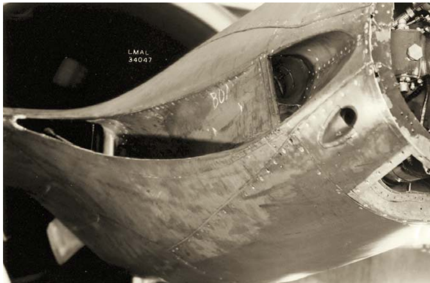
Détail des prises d'air initiales en cours d'expérimentation en soufflerie à Langley en 1943.

Si durant les 43 heures de vol qu'il avait accomplies jusque là, le premier exemplaire avait été en mesure de démontrer les performances attendues, il aurait été possible d'adapter les changements nécessaires au second. Mais devant les faibles résultats obtenus avant l'accident, la perte du premier condamnant inexorablement le second à l'abandon pur et simple. McDonnell en fut informé le 24 octobre et la notification de la clôture du contrat fut formellement transmise le 27 octobre. Du fait de cette fin précipitée, l'installation des équipements de pressurisation et de l'armement ne fut jamais réalisée. Le rapport final établit le bilan financier du développement et des essais du XP-67 à un montant total de 4 624 927,89 dollars. Tout aussi logiquement, cet accident sonna le glas des moteurs Continental IV-1430. Un seul autre avion devait être équipé de ce type de moteur : la version de série du Bell XP-39E, le XP-76 qui fut lui aussi abandonné. Avec l'arrêt du XP-67 et les résultats décevants obtenus sur le XP-49, ce moteur ne fut finalement construit qu'en 23 exemplaires au total.