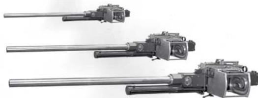
Envisagé dès août 1941 en remplacement des 20 mm, le canon M4 de 37 mm avait un encombrement important. Le XP-67 devait en emporter six placés de part et d'autre de l'habitacle, dans la portion centrale des ailes.